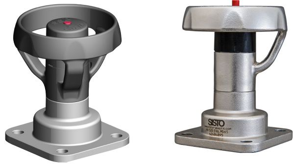
SISTO-C Handoberteil MD40-MD115 Optional: Edelstahlhandrad