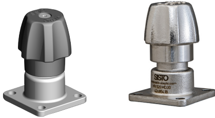
SISTO-C Handoberteil MD30 Optional: Edelstahlhandrad