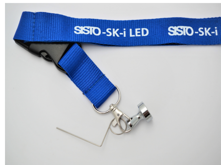
Aimant de programmation avec lanière pratique